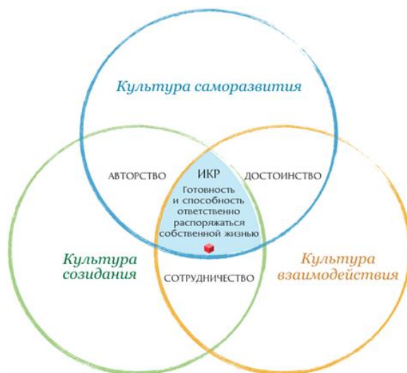
Рис. 1. Идеальный конечный результат образования в ОК

На уровне НОО главной задачей является создание предпосылок для ответственного распоряжения собственной жизнью — становления субъекта действия и подготовка условий для становления субъекта собственного действия.